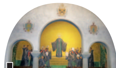
Mural de Pere Pruna a la Sala Capitular

seminari màrtir de Catalunya és el de Cervera. Després d'escapar-se'n un grup de més de cent estudiants, 14 va ser detinguts i afusellats al cementiri de Lleida. La seva memòria es conserva cada any amb una trobada al Camp dels Màrtirs del Mas Claret de Cervera.