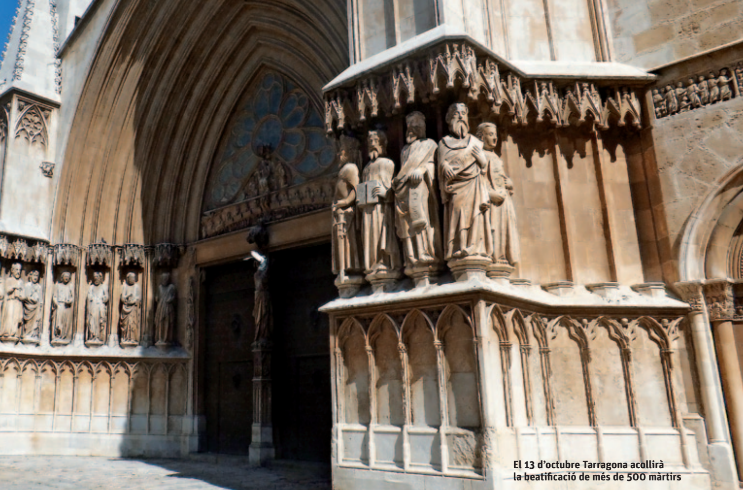
El 13 d'octubre Tarragona acollirà la beatificació de més de 500 màrtirs

l'institut. A més de l'edició i difusió del testimoni d'aquests màrtirs, faran una celebració prèvia a les Avellanes i una vetlla a Barcelona. També volen agrair el testimoni de les persones que van acollir els nois i joves que van fugir de les cases de formació. "Sempre hi ha hagut un vincle molt especial entre aquests estudiants i les famílies dels pobles del voltant", diu Serra. La causa marista també inclou dos laics, cosa que ara enllaça amb el treball conjunt entre laïc i Vida Consagrada que ha emprès la majoria de religiosos.