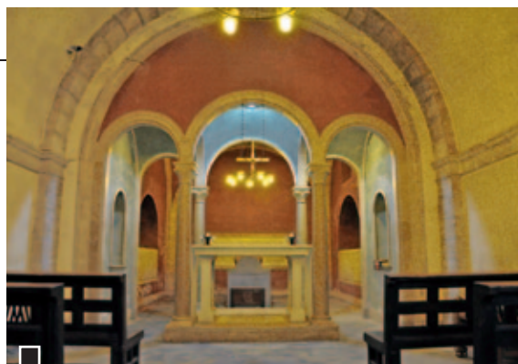
Cripta dels màrtirs a Montserrat