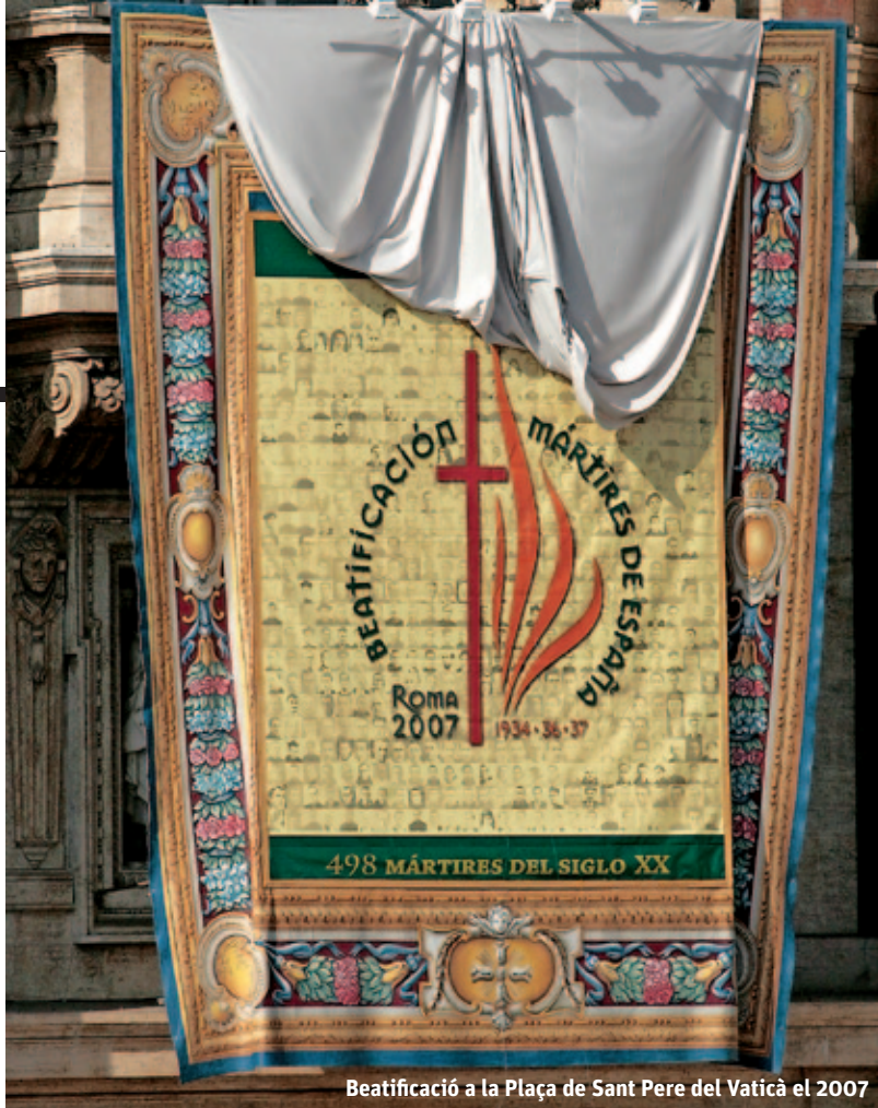
Beatificació a la Plaça de Sant Pere del Vaticà el 2007

Així, indefinidament i per principi, resulta forçat excloure del reconeixement públic eclesial valuosos testimonis de la fe pel simple fet que van ser morts durant la Guerra Civil espanyola. I es comprèn que, uns anys després de la instauració de la democràcia, es cursessin algunes de les causes de beatificació, iniciades feia anys, i se'n fes la proclamació a partir de 1987. Les successives i reiterades celebracions –i potser també, cal confessar-ho, alguns recels que suscitaven cada vegada– van moure la Santa Seu a cursar totes les causes pendents de beatificació en un futur no gaire llunyà. En total, el nombre de beats –alguns dels quals, mentrestant, ja han estat canonitzats– passarà del miler, xifra realment molt considerable, però que representa només una mostra dels cristians que van donar la vida per Crist en aquell enfrontament fratricida.