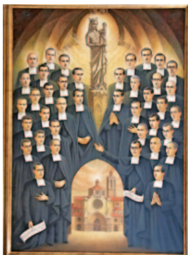
Màrtirs de La Salle i sant Jaume Hilari