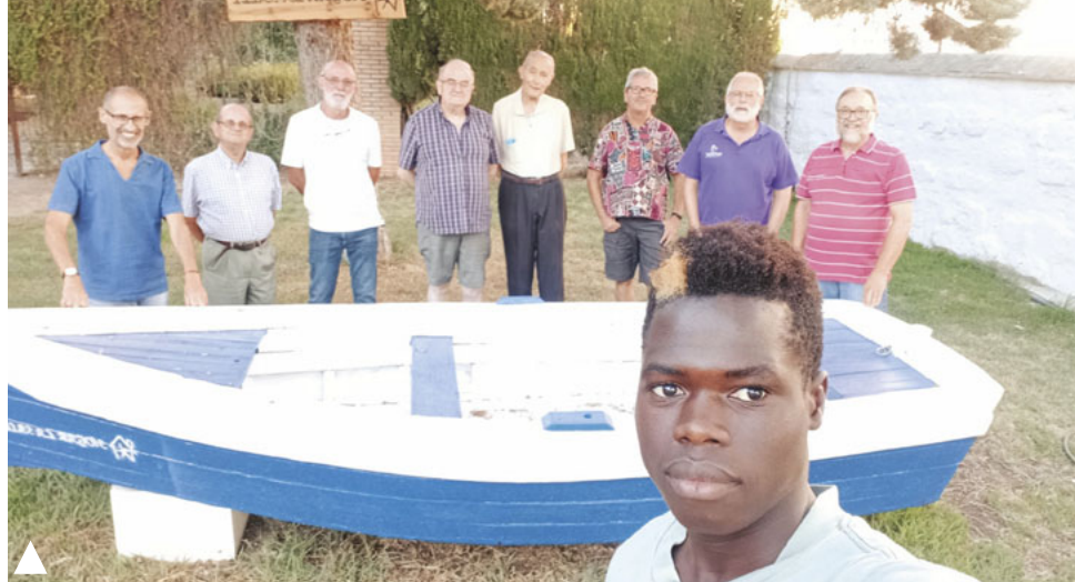
Lo religiosos, con uno de los jóvenes del Hogar de Emancipación