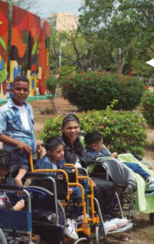
Algunos beneficiarios del Pequeño Cottolengo