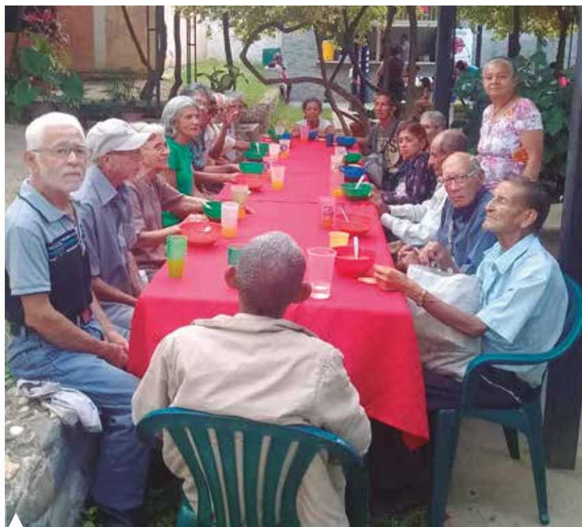
Un encuentro organizado por los orionistas con los ancianos de la parroquia de Guadalupe

el acceso a las medicinas, se apostó por un programa con fármacos llegados de España. Así varias salas de la parroquia se han convertido en consultorios médicos, con la colaboración de doctores voluntarios y Cáritas. Además, dice contar con “unos 600 voluntarios puntuales”: