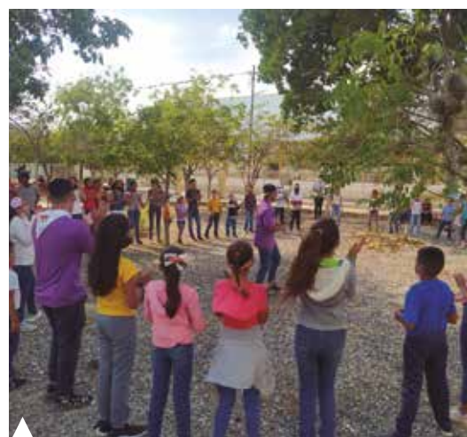
Un grupo de niños y adolescentes que forman parte de la misión popular de Don Orione

Desde “una gran sencillez, esta pastoral familiar ha tenido mucho eco, llegando a otras 50 parroquias de Barquisimeto y a otras diez diócesis, en un servicio social y de caridad. En 2018, en un momento en el que arreció la crisis nacional, estas familias se volcaron en la alimentación y el acompañamiento a muchas personas vulnerables”. Un gran ejemplo es la olla comunitaria, que cada domingo se ofrece a personas sin hogar.