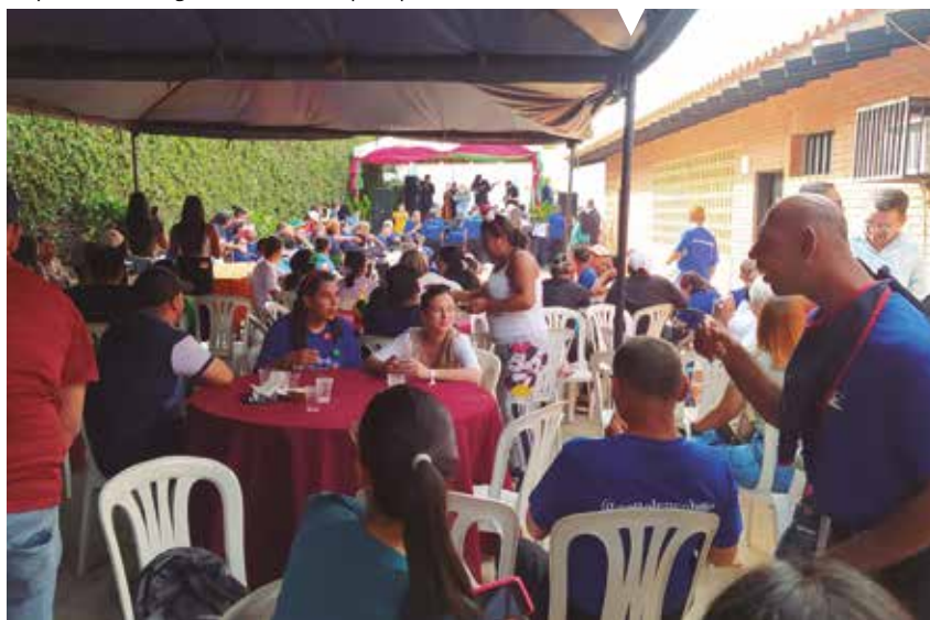
La apuesta de los orionistas pasa por la Pastoral Familiar